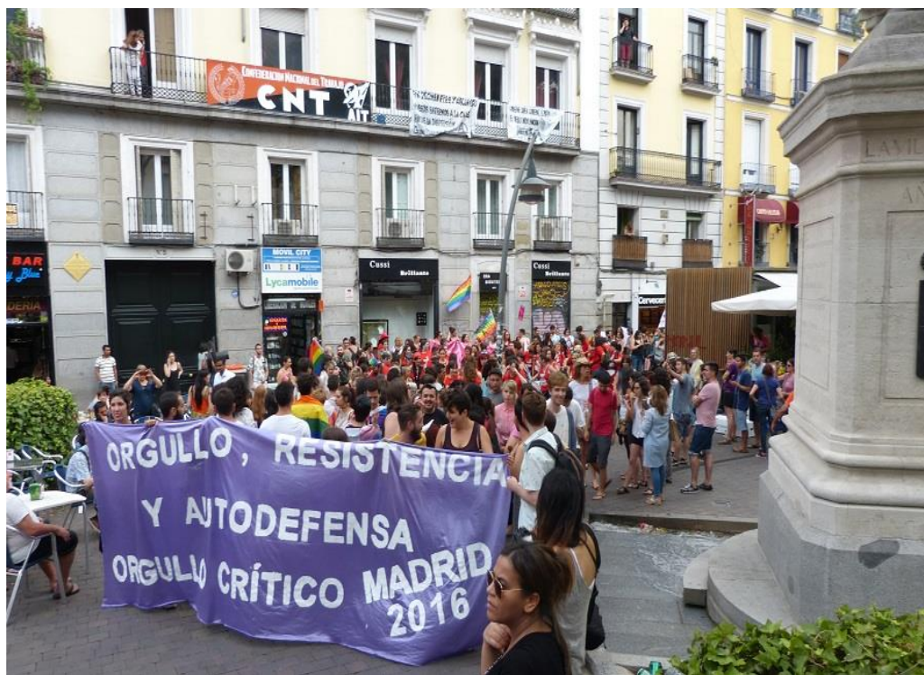
Madrid, 28 de junio de 2016. Cabecera del Orgullo Crítico saliendo de la Plaza de Tirso de Molina.